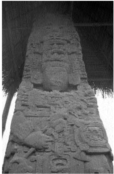
In Quiriguá (Provinz Izabal) sind die höchsten Stelen der Maya-Welt zu sehen.

Schon früh wurde die guatemalteckische Pazifikküste besiedelt. Dies bezeugt eine Vielzahl von Ausgrabungsstätten, von denen einige zu besichtigen sind. In Abaj Takalik , nordwestlich von Retalhuleu, kann man Tempelplattformen und Steinskulpturen mit olmekischem Einfluss besichtigen. Im Gebiet um Santa Lucía Cotzumalguapa hat man verschiedene Skulpturen und Stelen gefunden. Sie sind auf der Finca El Baúl , der Finca Las Ilusiones und etwas weiter östlich in La Democracia ausgestellt.