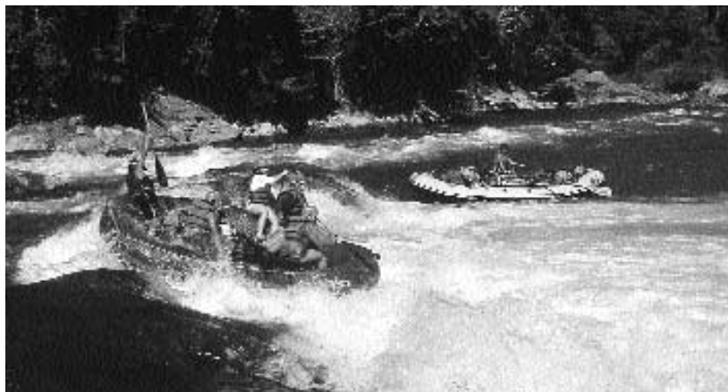
Viele Flüsse in Guatemala bieten ausgezeichnete Voraussetzungen für Wildwasserfahrten.

Die Provinzen Alta Verapaz und Izabal sind Badeparadiese. Die Laguna Lachuá in der Nähe von Playa Grande ist ein unvergessliches Erlebnis. Ein Bad in den Naturpools von Semuc Champey bei Lanquín sollte auf einer Guatemala-Reise ebenso wenig fehlen wie ein Sprung in den Izabal-See . Auch in der Gegend um El Estor gibt es zahlreiche saubere Flüsse. Wer im Petén Itzá-See schwimmen möchte, sollte sich eine ruhige Stelle an der Nordostseite suchen. In der saubereren Laguna Yaxhá tummelt sich noch das eine oder andere Krokodil. Ganz Mutige gehen dort trotzdem baden. Wer an der Grenze zu Belize in der Hitze warten muss, sollte die Gelegenheit wahrnehmen, sich im Río Mopán etwas abzukühlen.